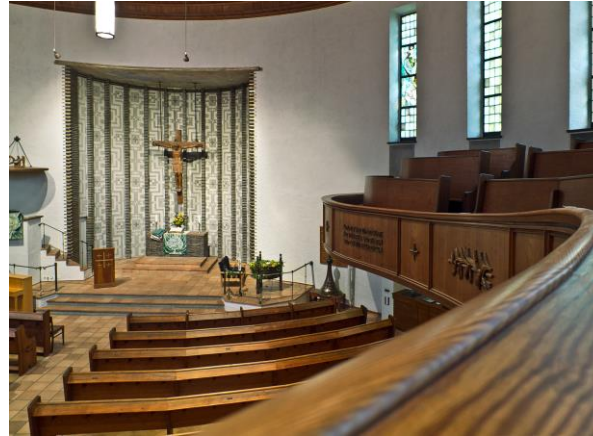
Blick in die Christophoruskirche